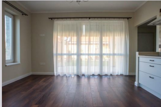
Blick in das Wohnzimmer Richtung Terrasse