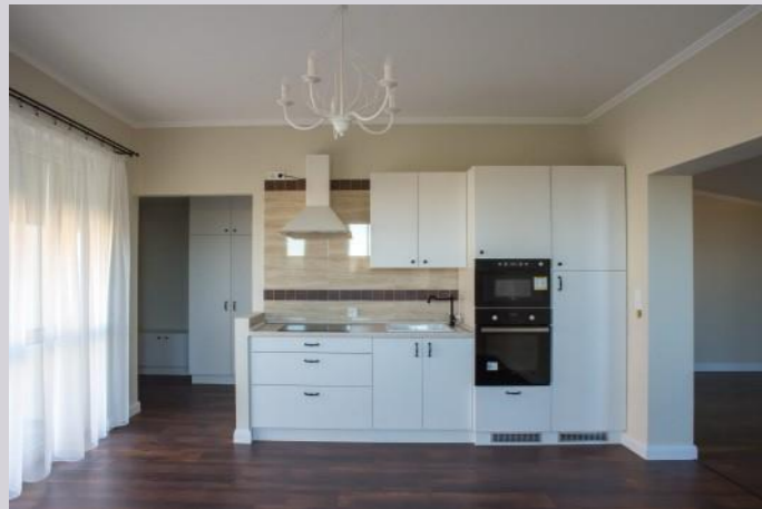
Blick auf die funktionelle Küchenzeile

Diese hat aber auch im angrenzenden Abstellraum ebenso Platz wie ein Wäschetrockner.