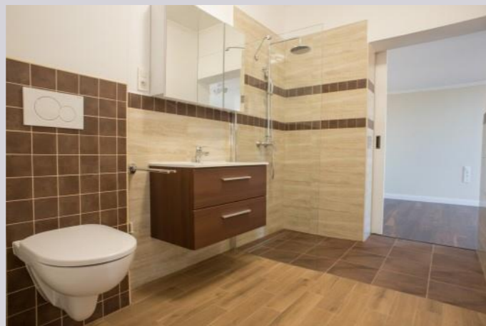
Blick in das barrierefreie moderne Bad