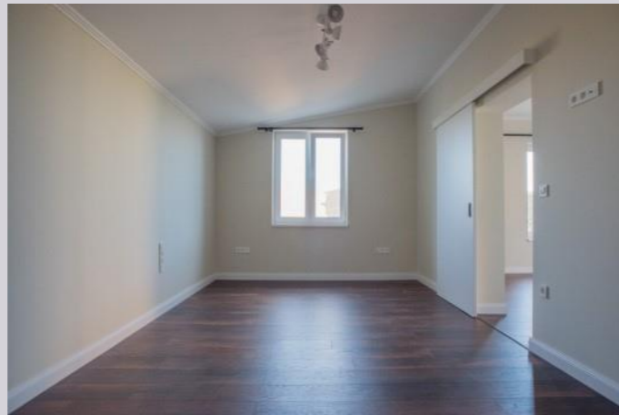
Blick in das großzügige Schlafzimmer

Ausreichend Platz ist hier für ein Doppelbett mit Nachtschrank, Kleiderschrank und wenn Sie möchten auch noch für einen PC-Tisch oder kleinen Schreibtisch.